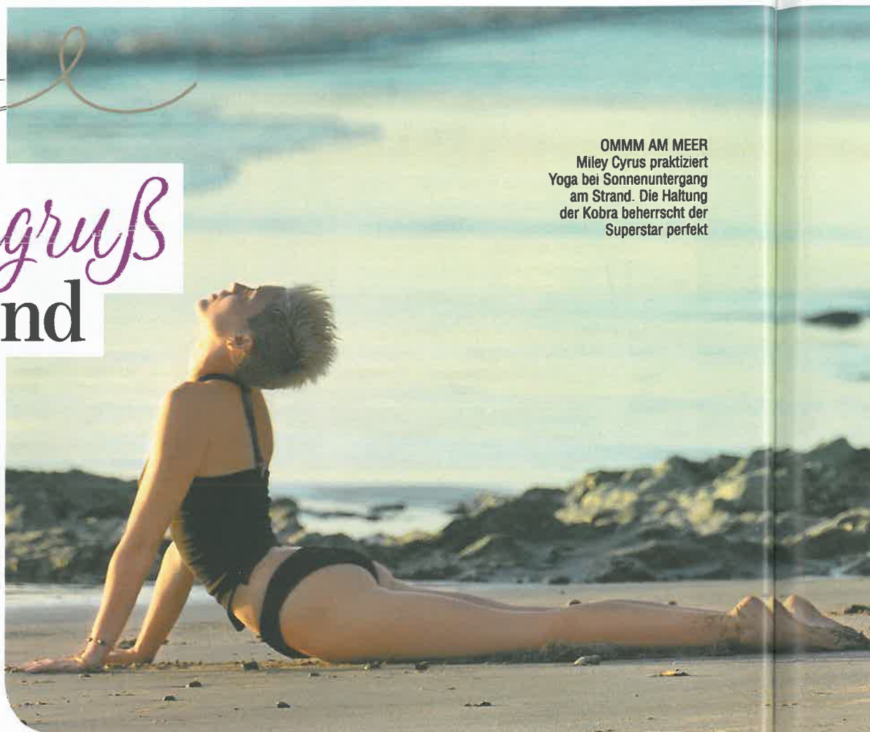
OMMM AM MEER Miley Cyrus praktiziert Yoga bei Sonnenuntergang am Strand. Die Haltung der Kobra beherrscht der Superstar perfekt