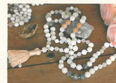
Handgefertigte Malas, www.padme-jooles. com, Preis je nach Stein ab 198 €

Glaube versetzt Berge. Die meisten Frauen spü- ren sofort, welcher Stein der richtige für sie ist.