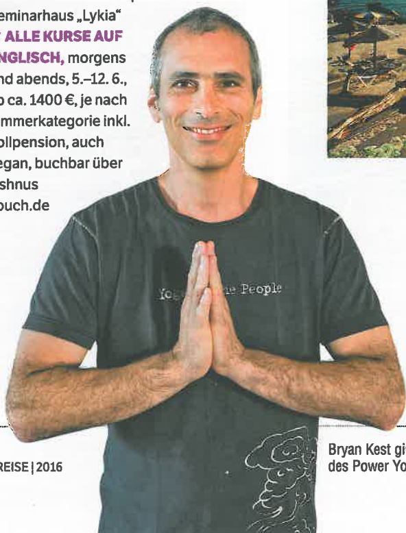
Bryan Kest gilt als Erfinder des Power Yoga

✦ BRYAN KEST , der charismatische Gründer von Power Yoga aus Los Angeles, veranstaltet in diesem Jahr nur ein Retreat in Europa – im Seminarhaus „Lykia“ ✦ ALLE KURSE AUF ENGLISCH , morgens und abends, 5.–12. 6., ab ca. 1400 €, je nach Zimmerkategorie inkl. Vollpension, auch vegan, buchbar über vishnus couch.de